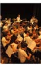
L'attività del laboratorio