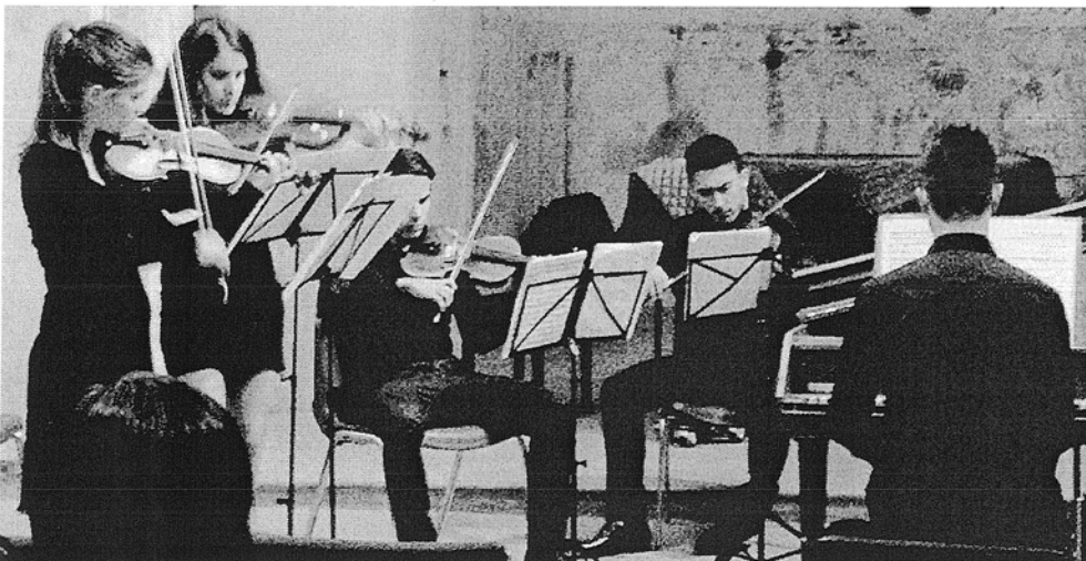
Un'esibizione dei corsisti della Summer School promossa dall'Istituto "Peri-Merulo"