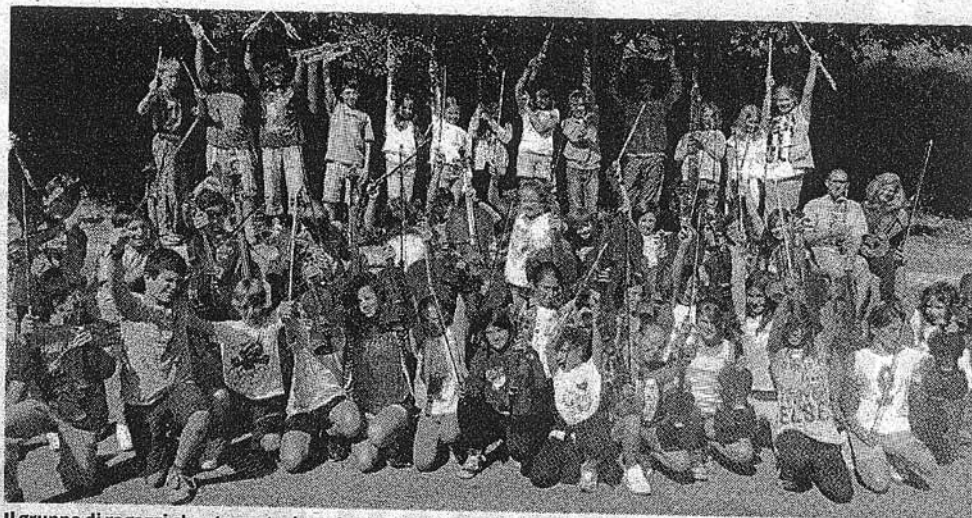
Il gruppo di ragazzi che sta partecipando alla "Summer School" dell'Istituto "Peri" a Ligonchio

Le manifestazioni finali sono due: dopo quella che si terrà a Ligonchio alle ore 18, ce ne sarà un'altra, domenica 1 settembre, alle 15,30, al Teatro