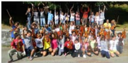
L'attività del laboratorio Orchestrale tenuto al giorno